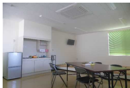
大村方製造部の女性専用の食堂及び休憩室です。ロッカールーム、シャワールームもあります。

東亜工機には親子・兄弟等家族で働く男性社員が多いが、今後は女性社員が定年まで働くことができ、その家族が入社したいと思えるような会社になりたいと考えている。