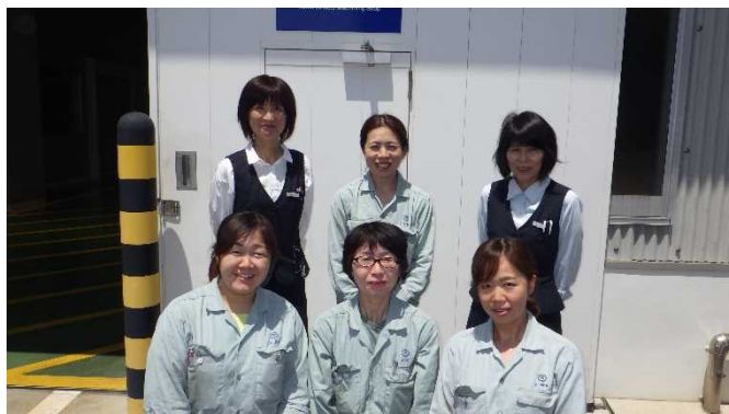
横田製造部の女性社員のみなさんです。それぞれ鑄造課・工作課・事務所にて活躍されています。